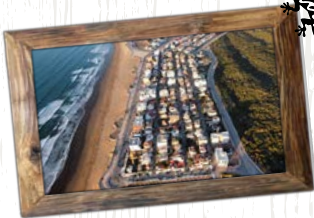
Ville Mehdiya 2022