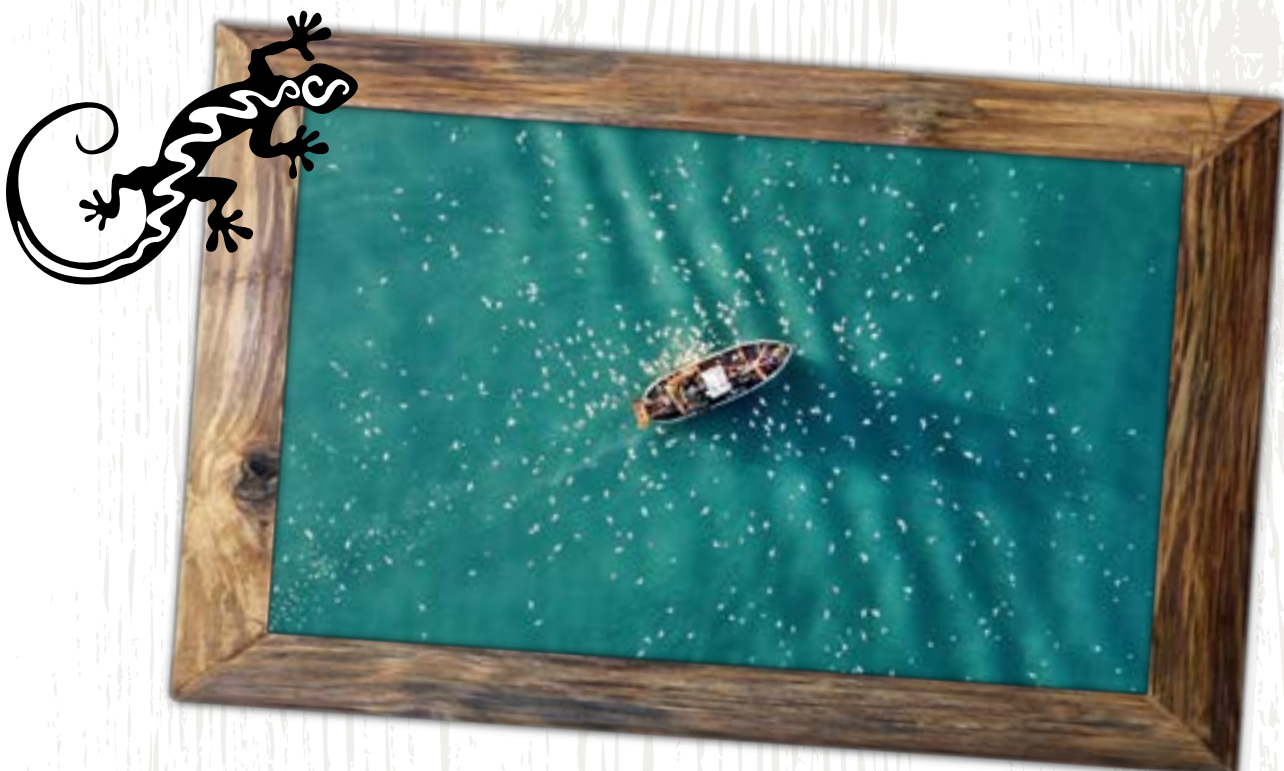
Bateau de pêche rentrant au port de Mehdiya

Merzouga est à votre disposition pour tout type d'événements (anniversaire, repas d'affaire...),