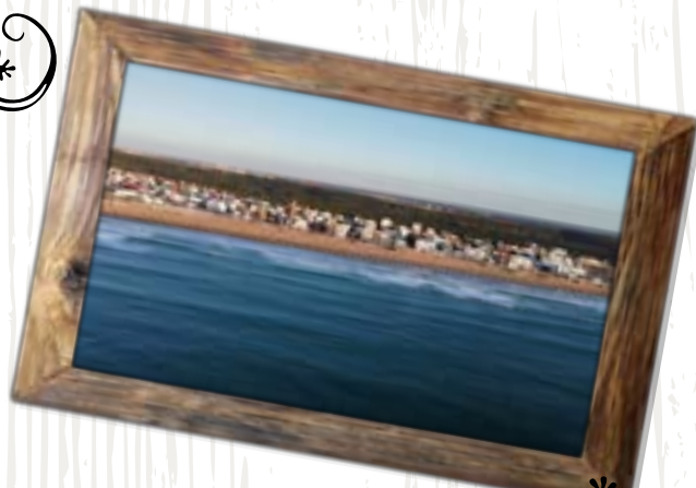
Photo de mehdiya prise par un surfeur de l'océan

A Mehdiya Plage, le restaurant Merzouga vous accueille tous les jours, dans un cadre magnifique avec une vue imprenable sur l'Océan Atlantique, et faire de votre passage un moment de détente et de plaisir gustatif.